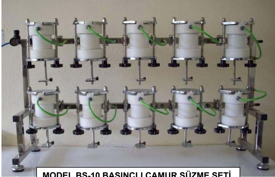
MODEL BS-10 BASINÇLI ÇAMUR SÜZME SETİ

Saturasyon çamuru süzmek için, ihtiyacınıza ve yer durumuna göre 10-75 adet numuneyi aynı anda ve basınçla süzecek özel-dizayn modellerimiz mevcuttur.