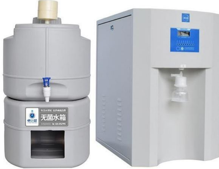
SAF SU TANKI (OPSİYONEL)