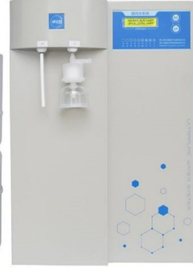
ZYR-II ve ZYR-D