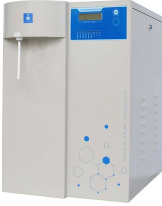
ZYR-I ve ZYR-III