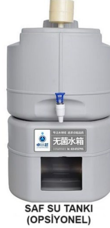
SAF SU TANKI (OPSIYONEL)