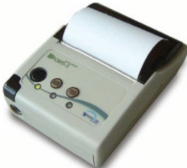
037.703 Termal Yazıcı * IrDA