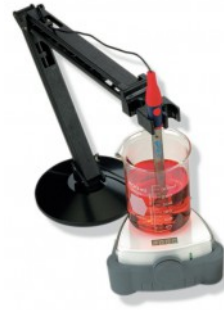
PROSENSE QA854X Akrobat Elektrod Tutucu