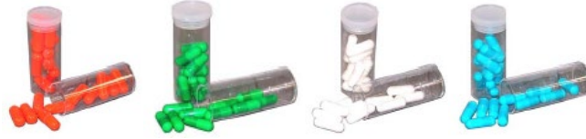
TAMPON TABLETLERİ (pH 4-7-9-10)