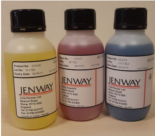
TAMPON SOLÜSYONLARI (pH 2-4-7-9-10)